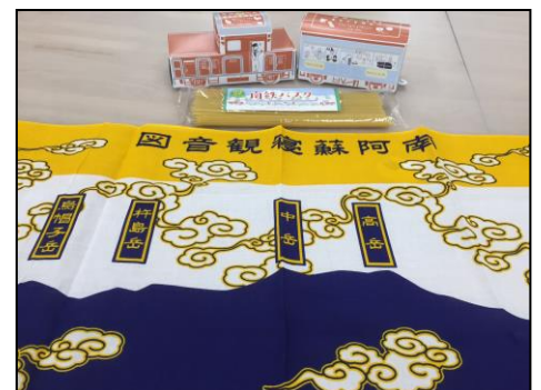
(写真奥)レトルトカレーパッケージ (写真中央)パスタパッケージ (写真下)阿蘇五岳手ぬぐい

(注)「一般社団法人 TAKAraMORI」は、平成28年6月にまちづくりや移住定住を目的として設立された会社。詳細については別添ファイル(PDF)又は、ホームページ参照 http://takaramori.com/author/takaramori/