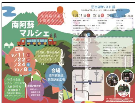
南阿蘇鉄道(株)イベントポスター