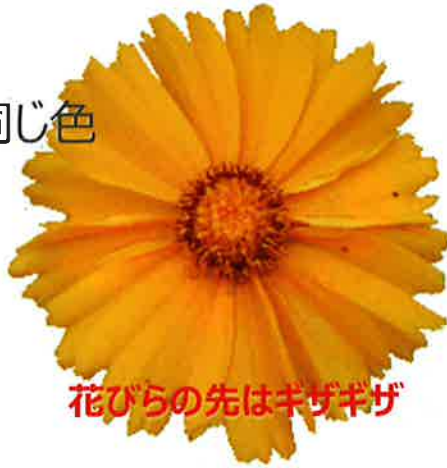
花びらの先はギザギザ