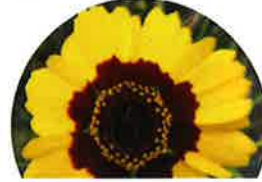
ハルシャギク (花の中心は濃紅色)