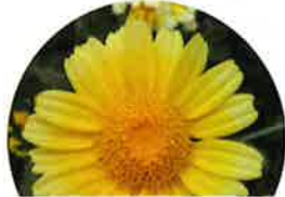
マーガレット (葉は羽状に切れ込む)