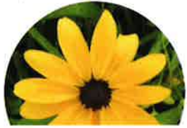
アラゲハンゴンソウ (花の中心は黒紫色)