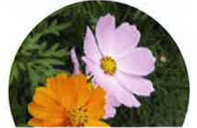
コスモス (花は秋に咲く)