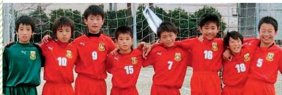
高SPOはスポーツ振興くじ(トコロ)の助成を受けた事業です。