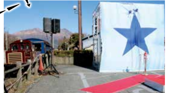
除幕式前にトロッコ列車出発見送り