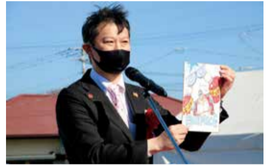
イラストを披露する中野編集長