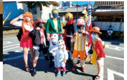
コスプレで会場を盛り上げてくれた人たち