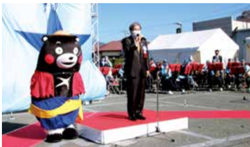
挨拶をする蒲島郁夫県知事 くまモン部長（左）