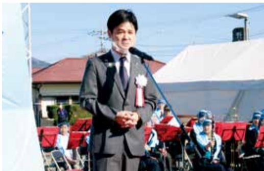
挨拶をする草村町長