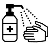
手指消毒用アルコールによる消毒の励行