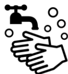
石けんによる手洗い