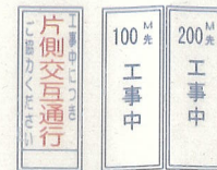
⑤ 片側交互通行看板 ④ 100m先 ⑥ 200m先