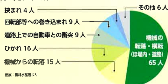
■死亡事故の原因件数（平成28年乗用型トラクター、農用運搬車）