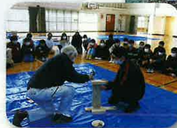
森林木工教室(菊陽町)