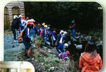
森林環境学習(山鹿市)