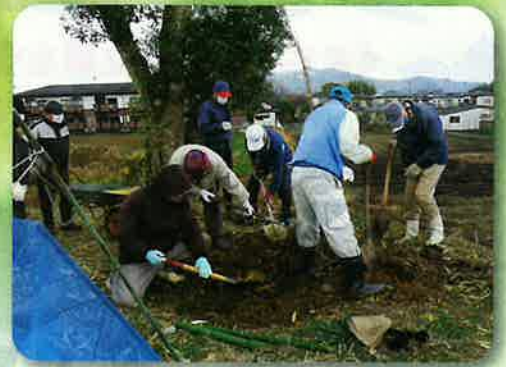
花木友の森(宇土市)