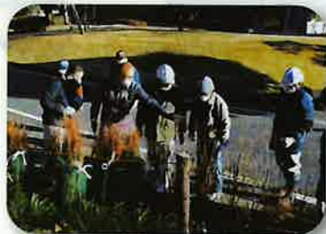
県民参加の森林づくり(西原村)