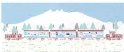
トロッコ列車 (手ぬぐい)

高森町に事務所を構え独立して起業する事も可能で、町もあなたの起業を全面的にバックアップします。