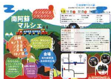
イベントポスター