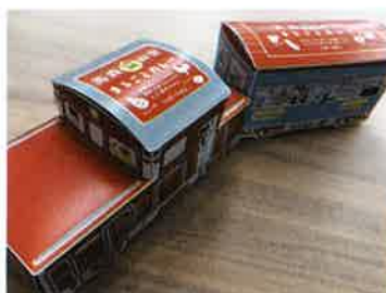
レトルトカレーパッケージ