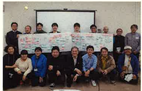
第2回のWSではバスへ乗り換え、バリアフリーについてや災害時の駅の役割について話し合いました。