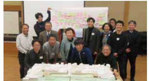
第1回WSでは多くの町民の方や隣町の方にもご参加いただきました!