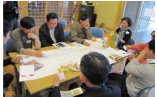
皆さんで高森駅リニューアルへのアイデアを出し合いました。