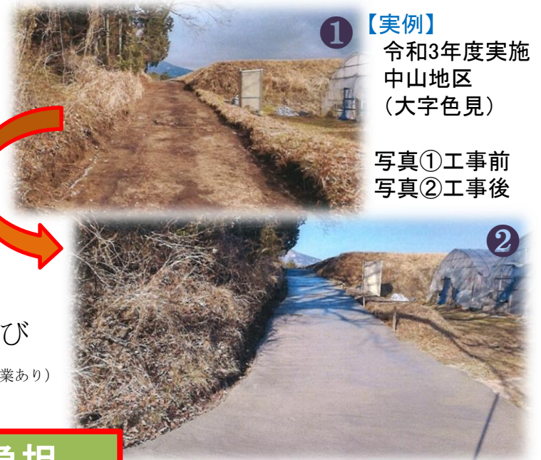
① 【実例】 令和3年度実施 中山地区 (大字色見)