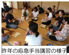
昨年の応急手当講習の様子

例年、梅雨明け頃に、水遊びや緊急時等の対応をふまえて「応急手当講習会」を開いた後に「プール遊び」をしています。緊急出勤がなければ「救急車両」も見学できます。会場は「上色見総合センター」です。