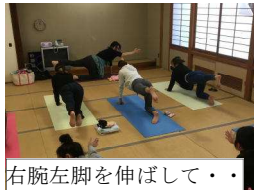
右腕左脚を伸ばして・・・

6/7(金)予定の「親子ヨガの会」が悪天候により延期になりましたので、新に募集しています。