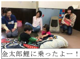
金太郎鯉に乗ったよー！

☆ 5ヵ月なのでまだ分からないだろうと思いつながりながら初めて参加したのですが、絵本をじーっと見ている姿があり、家でも時間をつくって絵本を読んであげたいと思います。(MH)