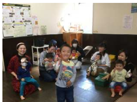
カスタネットを作ったよー

子どもは本来音楽好きですよね。特にリズム楽器には殆どのお子さんが反応します。色々なリズム楽器に触れ、簡単な楽器を作り、その音を出しながら楽しんで欲しいと思います。0歳からでも充分楽しめますよ。