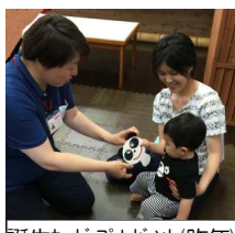
誕生カードプレゼント(昨年)

今年度第1回目の誕生会です。お誕生日を迎えたお子さんだけでなく、まだ誕生日を迎えていないお子さんもお祝いする方で参加されませんか？