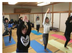
両手を上げて片足立ち

この会はいつも好評でこのところ会場も高森総合センターの和室を使用していることもあり、今年は本センターに「ヨガマット」を購入しましたので定員を10名にしました。どしどしお申込み下さい。