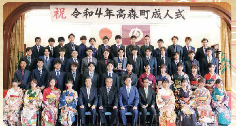
高森町教育委員会 社会教育係 ☎0967-62-0227