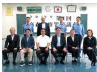
協議会委員さんと署員

令和4年度第1回協議会を6月13日、高森警察署で開催しました。その後、警察署長、副署長等の幹部の面々と、意見交換を行いました。今年度は、後2回開催される予定です。今後とも、協議会委員の方々と意見を交換し、より、地域に密着した警察業務の運営を行っていきます。