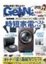
GetNavi 2023年7月号 CAPA 2023年6月号