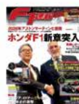
F1速報 2023 Rd07 モナコ& Rd0... 月刊剣道時代 2023年7月号