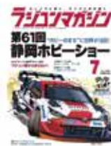
ラジコンマガジン 2023年7月号 OCEANS (オーシャンズ) 2023年7月号