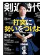
月刊剣道時代 2023年7月号 ヤングマシン 2023年7月号