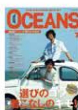
OCEANS (オーシャンズ) 2023年7月号 デジタルカメラ マガジン 2023年6月号