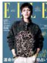
ELLE JAPON エル・ジャポン 202... GetNavi 2023年7月号