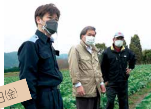
蒲島知事による現地視察の様子

10月21日には蒲島知事、22日には田嶋副知事が降灰による被害状況を確認するため、特に被害を受けた色見地区、上色見地区を視察されました。