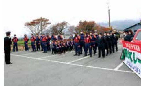
高森駅駐車場に並ぶ消防団および幼年消防団

11月9日(火) 秋季全国火災予防運動の開始に伴い、消防団員によるパレードが実施されました。幼年消防クラブとして参加した高森幼稚園児による和太鼓の披露、防火の誓いが宣言され、火の取り扱いに関する注意喚起が行われました。